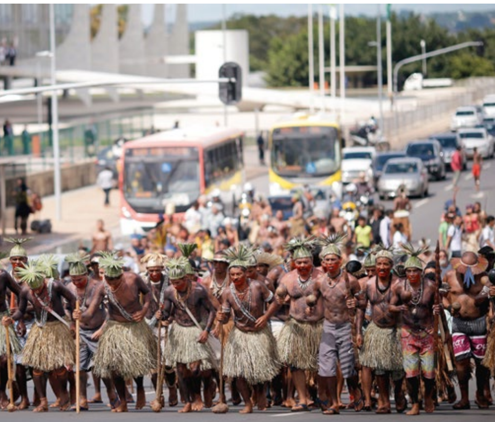
Les gens manifestent pour leur participation dans les questions des terres et des droits indigènes.

l'élargir, quand c'est possible. Cela passe d'une part par des projets dans lesquels nous mettons en réseau de façon ciblée des ONG locales, en analysant en commun le contexte juridique et politique et en favorisant le dialogue avec les autorités gouvernementales.