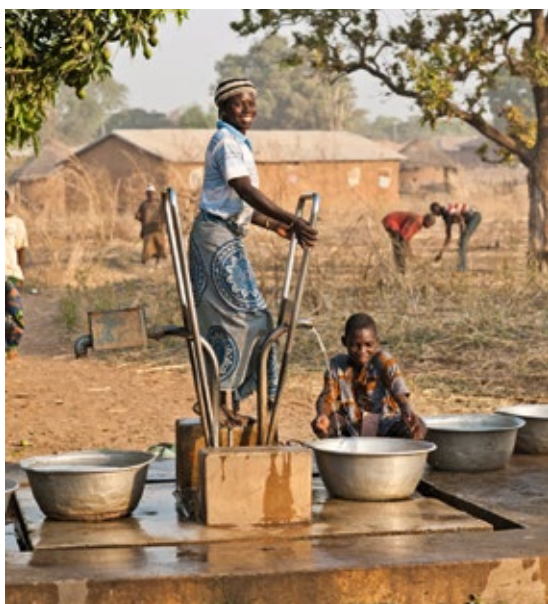
Pompe à pied: de l'eau propre devient disponible dans le nord du Bénin.

Pour marquer la prochaine Journée mondiale de l'eau, Helvetas collabore également avec le musée: de nombreuses animations et ateliers seront organisés au Musée romain de Nyon le mercredi 21 mars 2018. Des informations détaillées sur cette journée seront données ultérieurement.