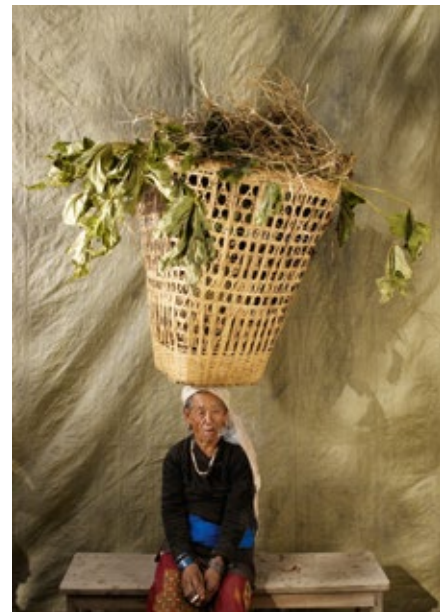
Mandebi au Népal a été chercher du fourrage.