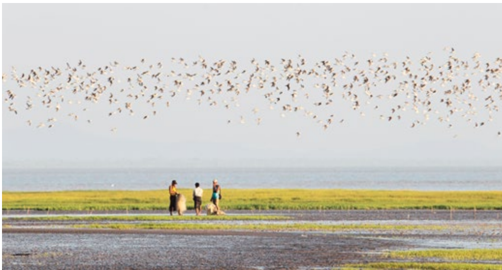
Le golfe de Mottama est un quartier d'hiver pour les oiseaux et une base d'existence pour les hommes.