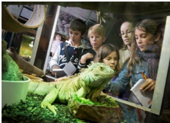
Des classes vont découvrir une étonnante diversité.