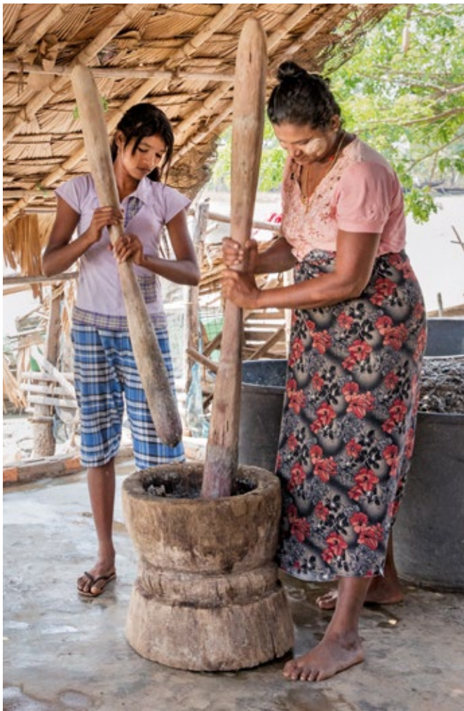
Les poissons invendables sont transformés en pâte de condiment.

Ces buts sont nombreux et complexes. D'autant qu'à ce jour, les pêcheurs ne pouvaient compter que sur eux-mêmes, ne bénéficiant guère de soutien ou de protection de l'État. L'organisation nationale des pêcheurs n'est pas présente dans la région. Les lois sur la pêche sont parfois contradictoires. Les autorités de contrôle manquent de personnel et, trop souvent, les pêcheurs fautifs peuvent se racheter auprès des contrôleurs. «Les habitants sont confrontés à un vide institutionnel», écrit l'expert en pêche Venkatesh Salagrama dans un rapport sur la situation de la pêche dans le golfe de Mottama. Ceux qui s'engagent pour la communauté des pêcheurs doivent s'attendre à un parcours du combattant. Pour les organisations communautaires, l'essentiel est de commencer à la base.