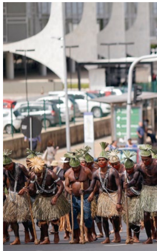
Des représentants des peuples autochtones brésiliens

Quand le produit national brut s'élève sans cesse mais que tout espace de liberté est refusé à la société civile, aucun