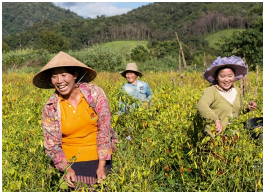
Les membres de la coopérative de légumes Hoy savent maintenant comment s'organiser et représenter leurs intérêts.

On trouve néanmoins au Laos des exemples encourageants d'engagement collectif, comme le montrent plusieurs projets d'Helvetas. Il est essentiel que les initiatives rurales soient centrées sur l'amélioration des conditions de vie. La population découvre ainsi ce qu'il est possible d'obtenir en agissant ensemble. Mais l'encouragement des organisations paysannes ou des groupes d'intérêt professionnels comme les tisserandes montre aussi aux autorités que ces groupes peuvent apporter une pré-