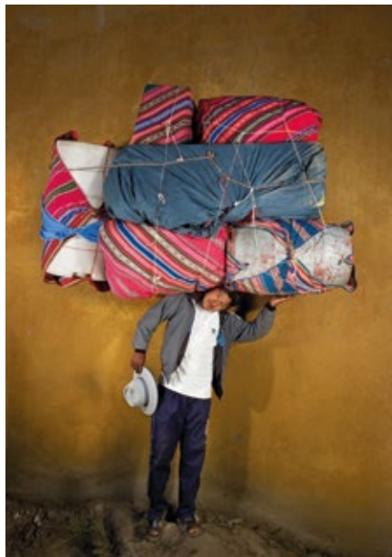
Freddy en Bolivie porte des récipients d'eau.