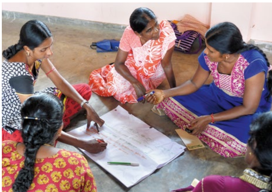
Des femmes participent à un atelier sur les conflits, dirigé par de jeunes animatrices.