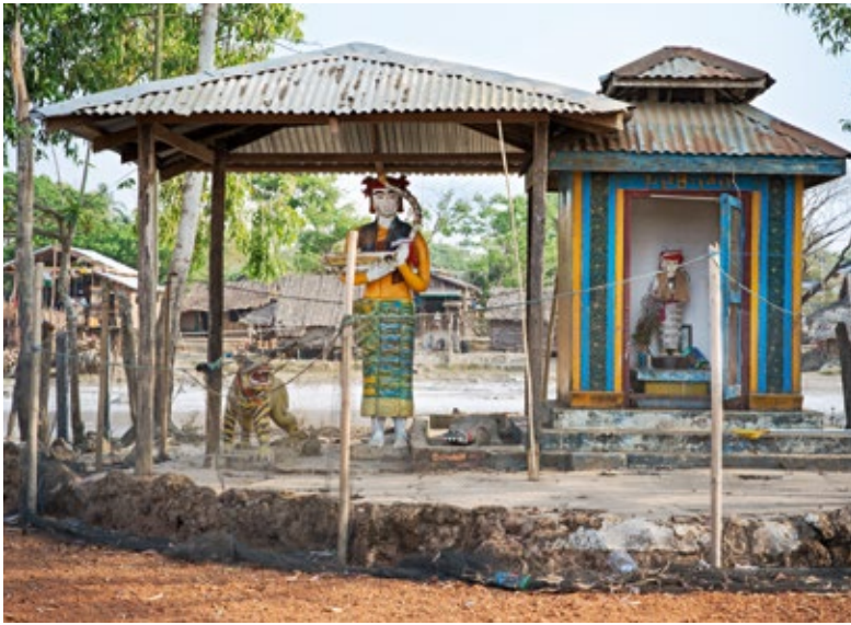
L'esprit protecteur: U Shin Gyi veille sur les sorties en mer des pêcheurs.

jeunes époux partent souvent en mer ensemble pour plusieurs semaines. Marée basse et marée haute régissent les jours.