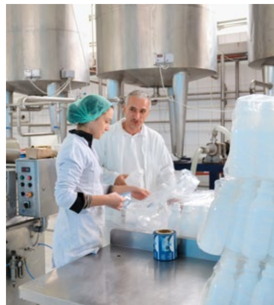
Soutenir le potentiel: transformation du lait à Kamenica.