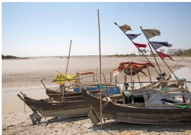
En cale sèche: les bateaux attendent la prochaine grande marée haute.

Le reportage multimédia sur Myanmar est sur http://reportages.helvetas.ch