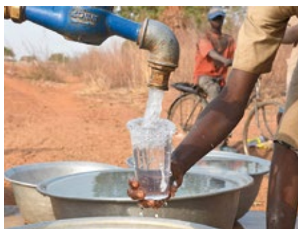
Eau potable: des projets d'Helvetas au Bénin la rendent accessible.

L'accès à l'eau potable reste une préoccupation dans de nombreuses régions