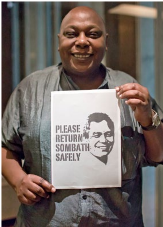
Maina Kiai s'engage pour la libération de l'activiste laotien Sombath Somphone.

de devoir s'excuser seulement parce que l'on défend les valeurs démocratiques. Partout dans le monde, la majorité des gens veulent la démocratie, la liberté et la prospérité qui va de pair. Certains pays sont un modèle pour eux – et ces pays justement doivent tout mettre en œuvre pour répondre à ces attentes.