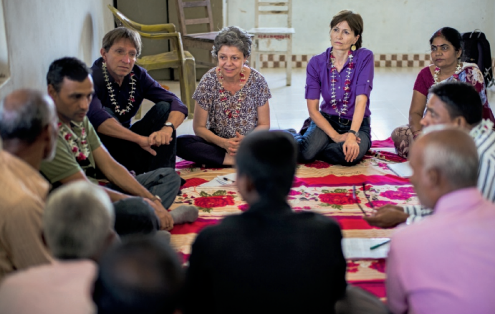
Regula Rytz (en violet) en 2017, lors de la visite d'un projet en lien avec la migration au Népal.

mondiale vit dans des pays gérés de manière démocratique, plus d'un tiers habitent dans des dictatures. Les personnes ont besoin d'espoir, les enfants de la possibilité de s'instruire, les jeunes et les adultes de perspectives d'emploi. Et tous ont besoin d'un environnement intact. Cet objectif, nous ne l'atteindrons que si nous renforçons la collaboration internationale et prenons au sérieux les Objectifs de développement durable. J'ai l'espoir que les gouvernements, les parlements et l'économie feront un effort pour que nous parvenions à assurer la survie de la planète. Pour le dire autrement: le temps sera moins au beau fixe et un peu plus tempétueux.