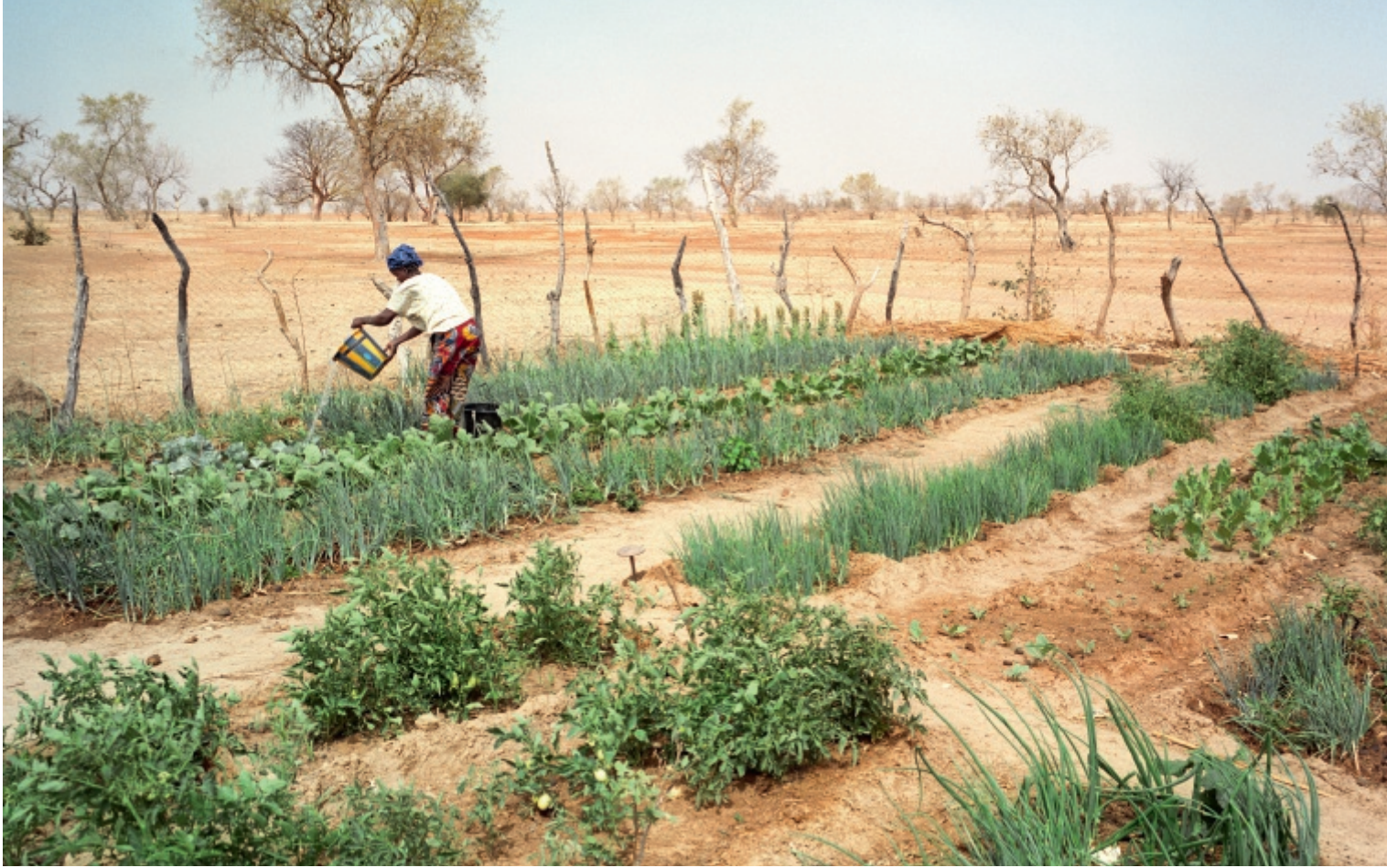
Le changement climatique fait que les femmes doivent redoubler d'efforts pour cultiver des légumes dans le désert. Elles en ont besoin pour nourrir leurs familles.