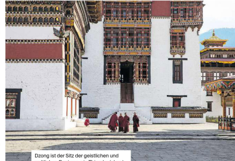
Dzong ist der Sitz der geistlichen und weltlichen Regierung in Thimphu (oben), Buddhistische Gebetswipfel zieren die Landschaft Bhutans (unten).