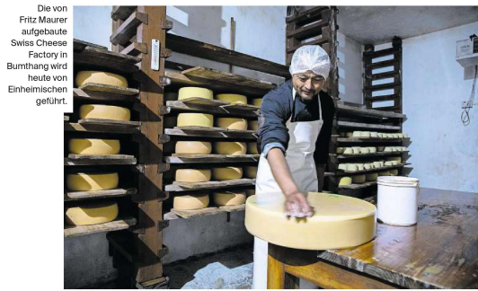
Die von Fritz Maurer aufgebaute Swiss Cheese Factory in Bumthang wird heute von Einheimischen geführt.