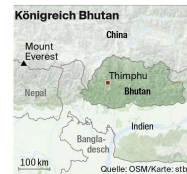
Königreich Bhutan Quelle: OSM/Karte: etb

bestimmen Thema sei. Ich erschreck und dachte: «Muss ich jetzt immer eine Meinung haben? Ich weiss gar nicht, was meine Meinung ist.»